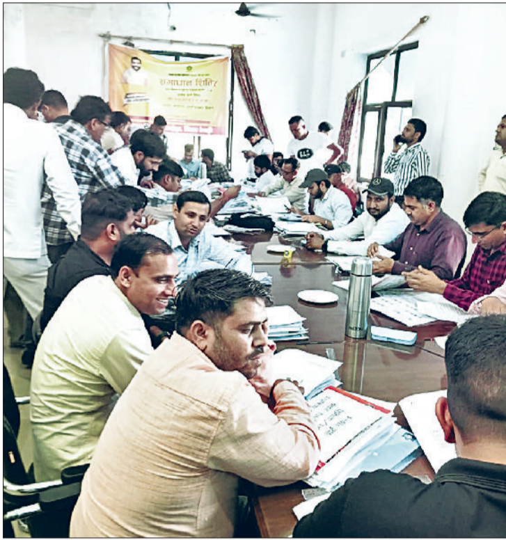
रेवाड़ी। मतदाता सूचियों की जांच करते हुए कर्मचारी व लोगों की भीड़।