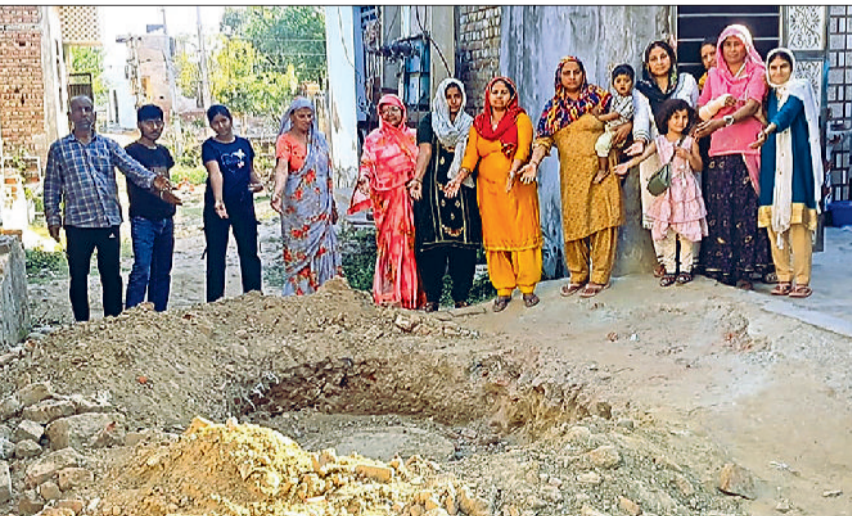
पंद्रह दिनों से खुला पड़ा सीवर होल, लोगों को हादसे का डर