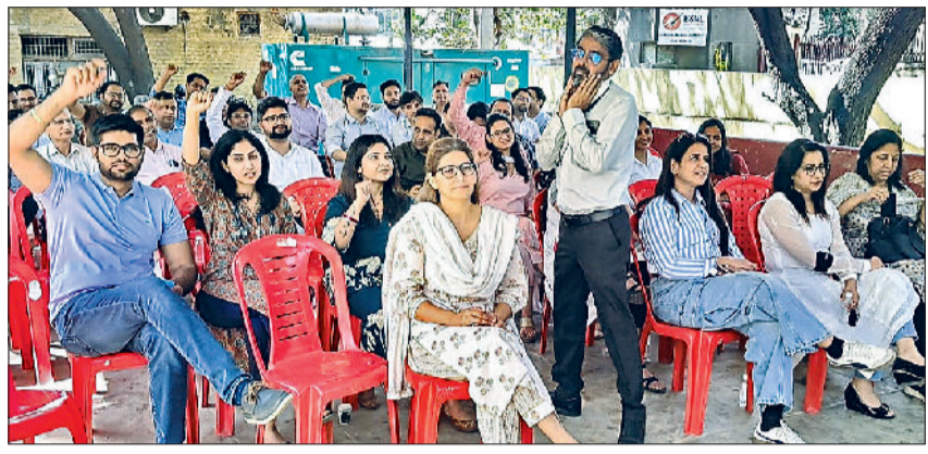
रेवाड़ी। नागरिक अस्पताल में हड़ताल पर बैठे डॉक्टरों।

ओपीडी की पूर्वी तक भी नहीं बनाई जा रही है। डॉक्टरों ने सरकार से मामले की निष्पक्ष जांच कर दोषी पुलिसकर्मियों के खिलाफ सख्त कार्रवाई करने की मांग की